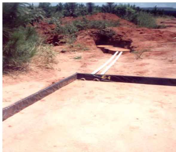
Figura 1 – Segmento de estrada florestal e coletores de água de chuva. Figure 1 – Forest road segment and rain water collectors.